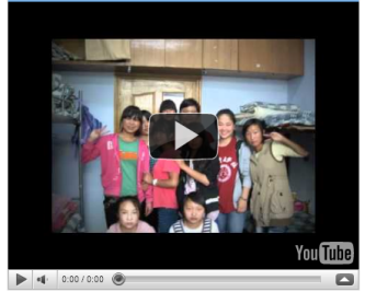
2010 AHRP Student Action Team's Trip to Moxi, Sichuan