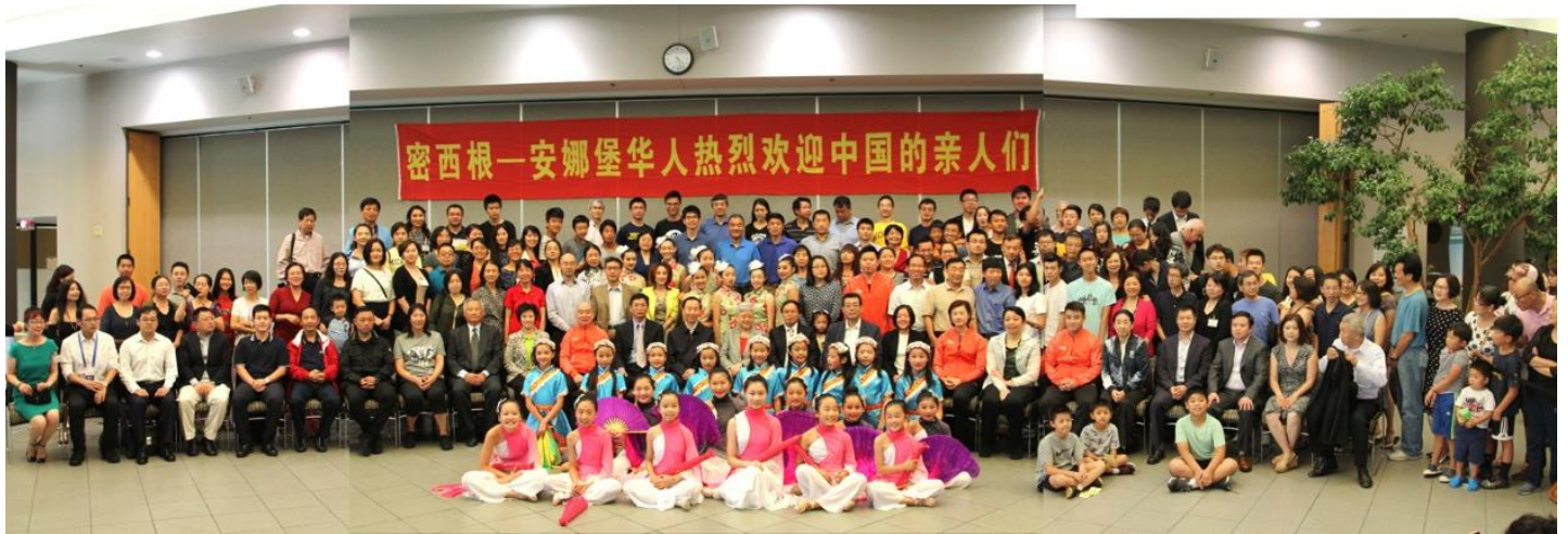
安华中文学校与中国乒乓代表团隆重纪念中美乒乓外交 45 周年合影