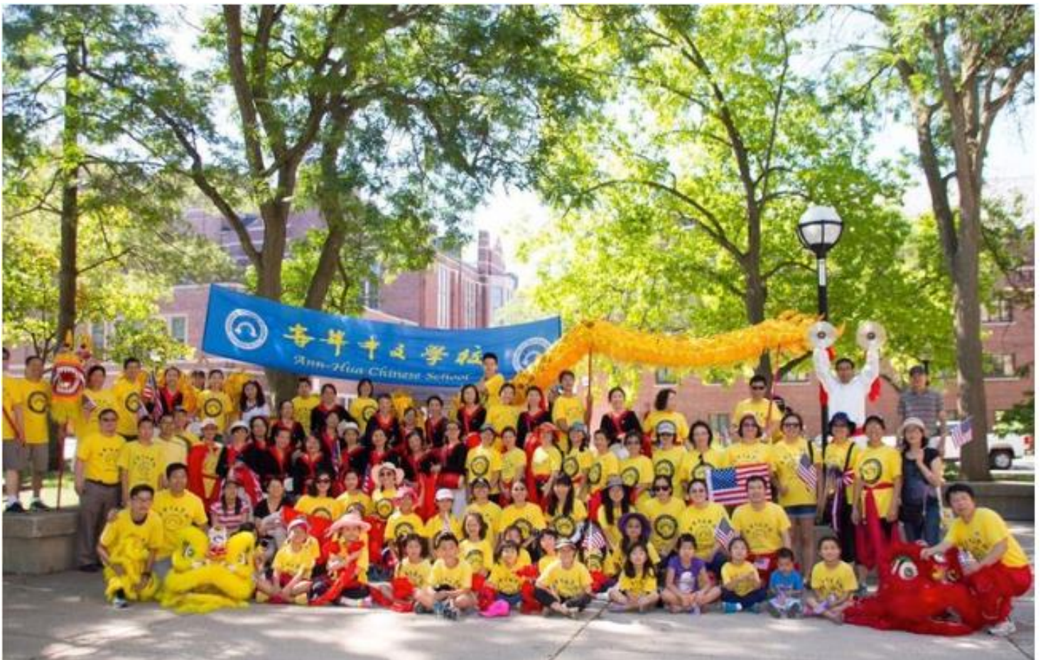
安华中文学校参加安娜堡 July 4 th 美国国庆日游行队伍合影