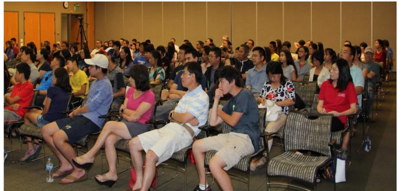
2017 安娜堡大学论坛会场