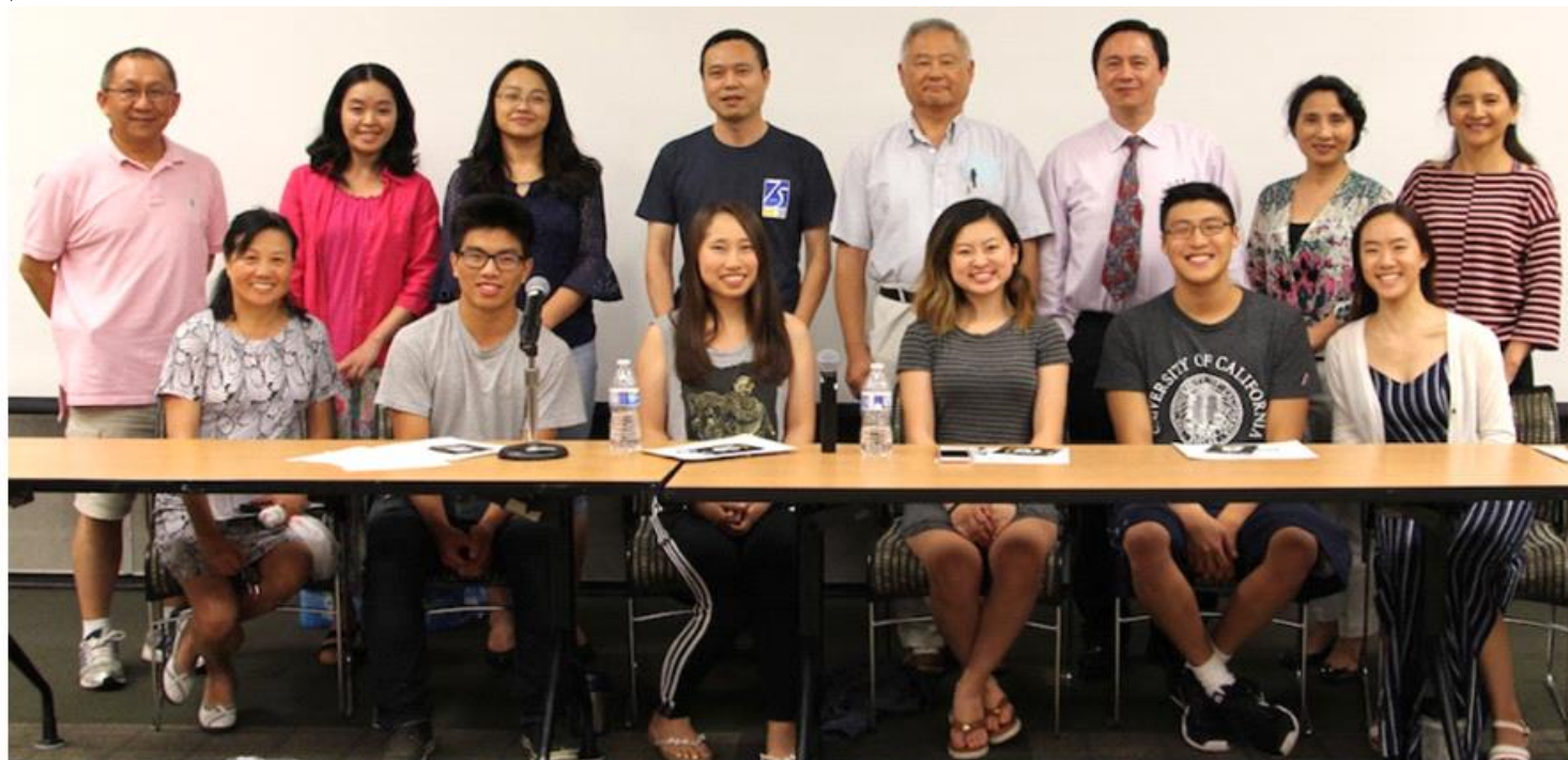
安华中文学校及活动中心领导与主讲学生和家合影留念 2017年8月5日摄于WCC ML 103

最后的提问环节，家长们纷纷地向各位主讲嘉宾表示感谢和祝贺，同时也提出了关心的问题。例如考SAT/ACT的分数对申请学校是否有影响？什么独特之处使你被将要去的大学录取？是否参加过Kumon Program？暑假作业的利与弊？中文学校的作业需要花多长时间完成等等。家长们一致表示：论坛为他们提供了很多信息，非常有帮助。